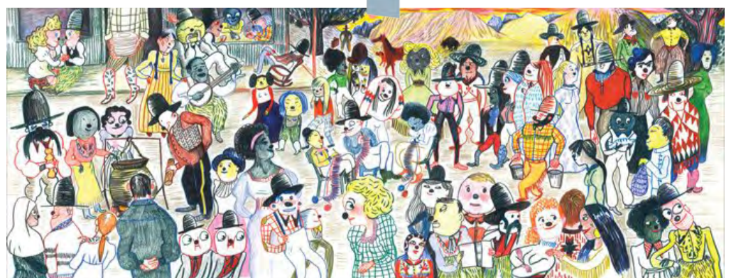
Image de Farwest pour introduire l'atelier