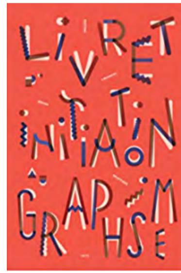
«Livret d'initiation au graphisme» Sophie Cure, Aurélien Farina